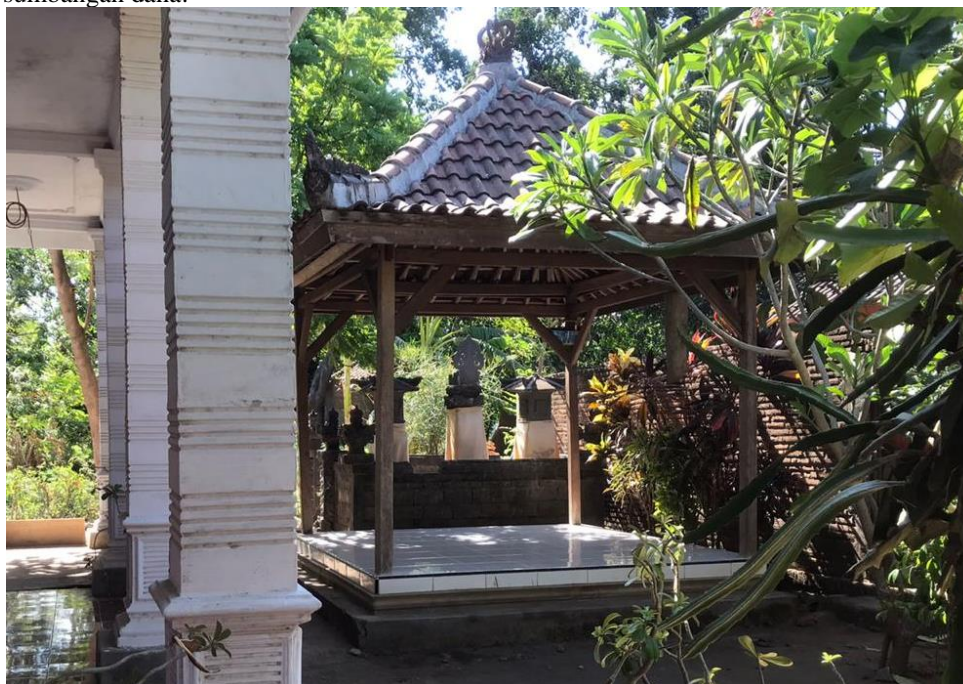
Gambar 4. Salah satu pura yang didirikan berdekatan dengan masjid di Desa Wonorejo.

Tim peneliti juga menemukan masjid dan pura sebagai tempat ibadah masing-masing agama (Islam dan Hindu), yang dibangun berdekatan. Bahkan menurut Slamet, pembangunan masjid dan pura di Desa Wonorejo mengandalkan gotong royong sesama warga. Orang Hindu dan Kristen juga ikut berpartisipasi dalam membangun masjid tempat ibadah orang Islam. Begitu juga dengan orang Islam yang ikut berpartisipasi dalam pembangunan tempat ibadah dari agama lain, baik warga yang beragama Hindu (pura) maupun warga yang beragama Kristen (gereja). Bentuk gotong royong yang dilakukan warga Desa Wonorejo juga bermacam-macam, bisa melalui sumbangan tenaga, sumbangan pangan, maupun sumbangan dana.