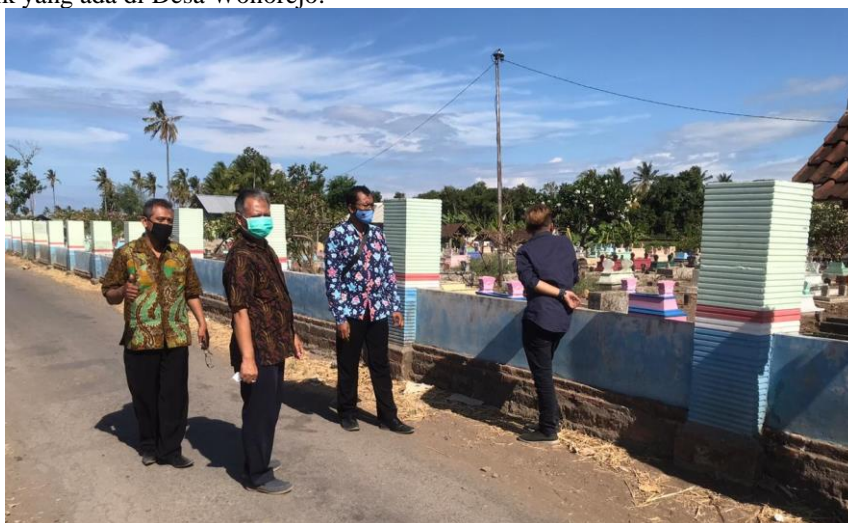
Gambar 3. Kunjungan tim peneliti dan tim pendamping ke Makam Kebangsaan, makam warga desa dengan berbagai corak keagamaan.

Menurut wawancara dari Trisno dan Slamet beserta beberapa penduduk Desa Wonorejo, dua kunci dari kesejahteraan Wonorejo selama ini adalah pluralisme dan toleransi. Label kebangsaan yang selama ini tersemat kepada Desa Wonorejo sejatinya terbangun dari pluralisme dan toleransi. Menurut data yang tim peneliti dapatkan, corak keberagaman warga Desa Wonorejo memang relatif tinggi. Mulai dari agama sampai mata pencaharian. Hal ini yang membuat Desa Wonorejo menjadi desa yang sangat plural ketimbang desa-desa yang banyak ditemui. Pluralisme ini juga ditunjukkan dengan simbol-simbol seperti tempat ibadah (pura, gereja, masjid), corak kegiatan, dan beberapa sarana-prasarana publik yang ada di Desa Wonorejo.